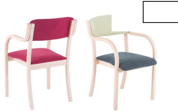
EXQ.UISIT de Lux AL