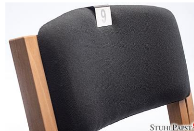
Edelstahlnummerierung Klemme Mittel